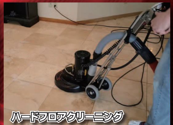
ハードフロアクリーニング