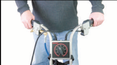
0~250rpmまでのスピードコントロールが可能

Rotary power head for High Performance Carpet & Tile Cleaning