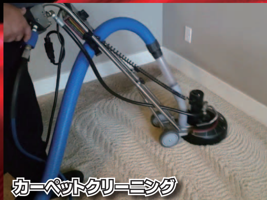
カーペットクリーニング