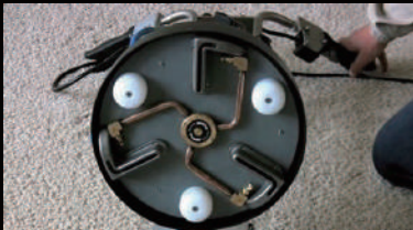
噴射ノズルの後にバキューム口ですぐさま吸引回収