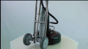
重量を感じさせない大型ホイールで運搬も楽ラク