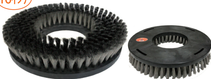
オットセイブラシ2nd 16インチ (シャンピング)

〔 型 番 〕 tr-0052 〔 毛 丈 〕 60mm 〔 サイズ 〕 16インチ 〔 カラー 〕 黒 〔 台素材 〕 樹脂 〔 プレート 〕 なし 〔 線 径 〕 0.15mm