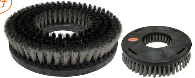
オットセイブラシ2nd 14インチ (シャンピング)

〔 型 番 〕 tr-0049 〔 毛 丈 〕 60mm 〔 サイズ 〕 14インチ 〔 カラー 〕 黒 〔 台素材 〕 樹脂 〔 プレート 〕 なし 〔 線 径 〕 0.15mm