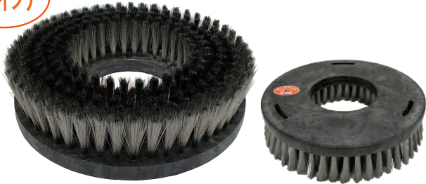
オットセイブラシ2nd 12インチ (シャンピング)

〔 型 番 〕 tr-0051 〔 毛 丈 〕 60mm 〔 サイズ 〕 12インチ 〔 カラー 〕 黒 〔 台素材 〕 樹脂 〔 プレート 〕 なし 〔 線 径 〕 0.15mm