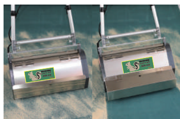
リノベーター無し リノベーター有り

標準付属品：ローラーブラシ×2本(青)、ブラシカバー(前・後) リノベーター(前・後)、輸送用トレー、清掃用ブラシ