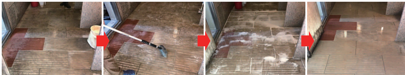
①洗浄前 砂岩タイル表面に黒カビが付いた状態。 ②ドルフィンモールドを床面に撒き、全体に馴染ませながらブラッシングしていきます。ポリッシャーも可。 ③洗浄後 30分放置して、黒カビの落ち具合を確認します。除去出来ていれば、しっかりと清水で流してください。 ④洗浄後の状態 ドルフィンモールドの液剤が残っていないかよく確認してください。